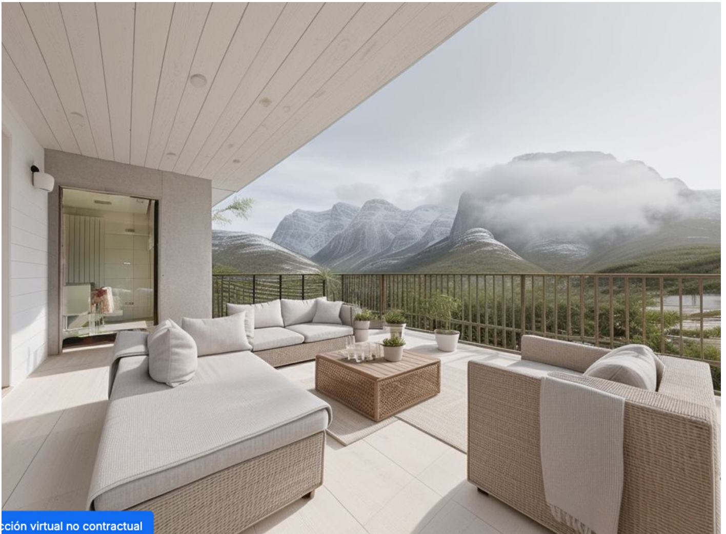
Imagen virtual no contractual